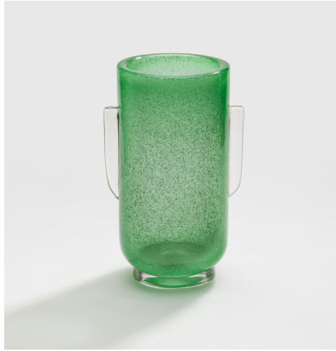
Carlo Scarpa (1906-1978) / Venini, A bollicine , 1934. Berlin, collection Holz