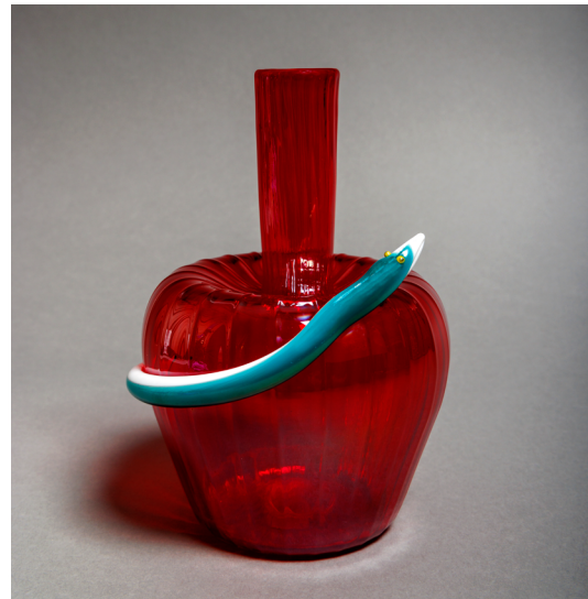
Cristiano Bianchin (né en 1963) / Vetreria Lucio de Majo, Bouteille au serpent , 1993. Saint-Cloud, département des Hauts-de-Seine, musée du Grand Siècle, donation Pierre Rosenberg.