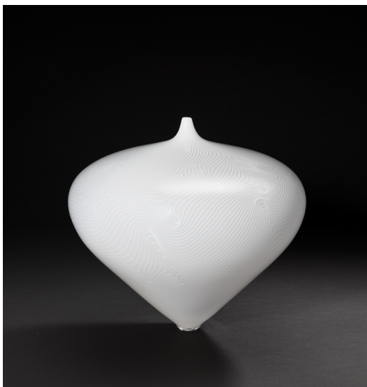
Lino Tagliapietra (né en 1934), Hopi , 2003. Berlin, collection Holz